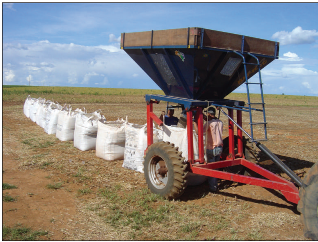
Big Bag 1 Spout | Big Bag 1 Boquilla

The Big Bag grain wagon comes equipped with a hydraulic system to elevate and lower the wagon structure, corresponding to the discharge height of all grain pick-ups and harvesters.